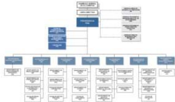
Gráfico 2: Estructura organizacional

Bancóldex mantiene una estructura organizacional adecuada para el cumplimiento de su labor y la consecución de sus objetivos estratégicos, en armonía con buenas prácticas de gobierno corporativo. Su administración es centralizada y tiene una estructura que genera una eficiente segregación de las funciones (Gráfico 2).